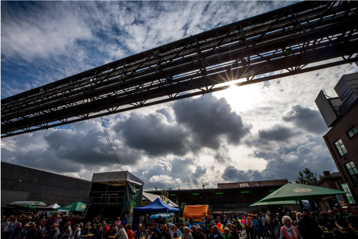
Eintritt frei beim Tagesprogramm mit Jever Bier, Brauereirundgängen und Bühnenshow.